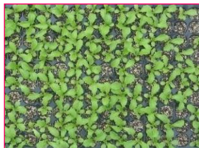
覆土無し苗 (レタス)