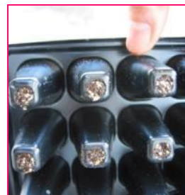
トレイ下の穴から水がしみ出してくる位が、初期灌水の適量です