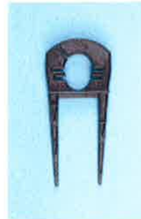
ネオドリップM用保持具